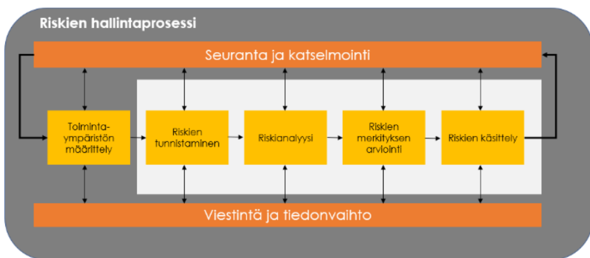
Kuva 5. Riskienhallintaprosessi. (SFS-ISO 31000)

Riskienhallintaprosessi sisältää olennaisena osana hallintaperiaatteita, menettelyjä ja käytäntöjen sekä järjestelmällistä soveltamista. Riskienhallintaprosessin keskiössä ovat riskien ja mahdollisuuksien tunnistaminen, arvottaminen, arviointi ja kontrollitoimenpiteet sekä riskien seuranta suhteessa valittuihin toimenpiteisiin.