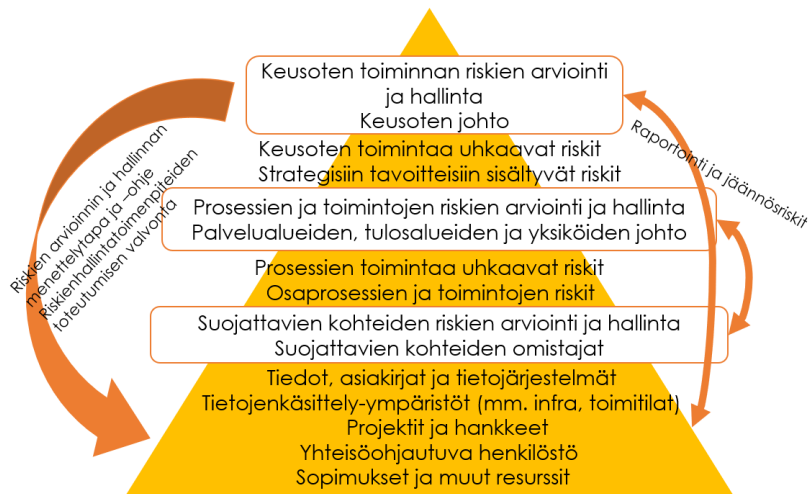
Kuva 2. Keusoten